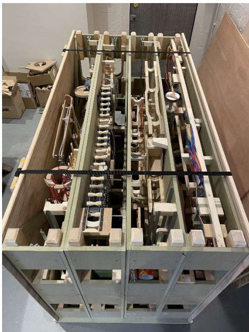
Panneau démonté, dans une boîte de 1m x 2m x 1.2m